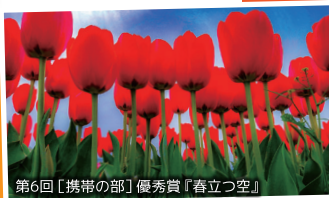
第6回【携帯の部】 優秀賞『春立つ空』