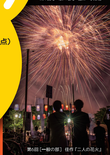
第6回【一般の部】 佳作『二人の花火』