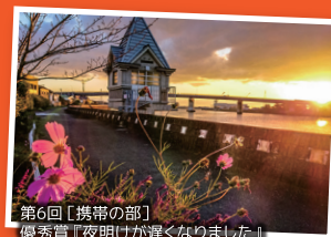
第6回【携帯の部】 優秀賞『夜明けが遅くなりました』