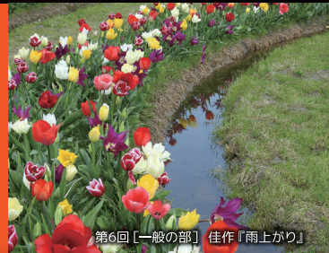
第6回【一般の部】 佳作『雨上がり』

北島町は旧吉野川と今切川に挟まれた「ひょうたん形」の島になっています。近年は急速に宅地開発や商業施設の立地が進んでおり、徳島県内でも有数の発展地域となっています。そんな北島町の「らしい」風景を見つけてください!そして今年から新しいテーマが追加!あなたの知っている魅力的な「北島町の人」を教えてください!