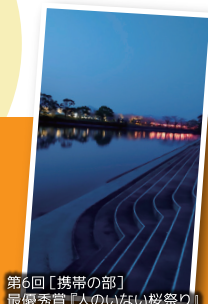
第6回【携帯の部】 最優秀賞『人のいない桜祭り』