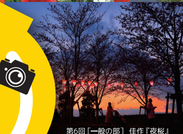
第6回【一般の部】 佳作『夜桜』