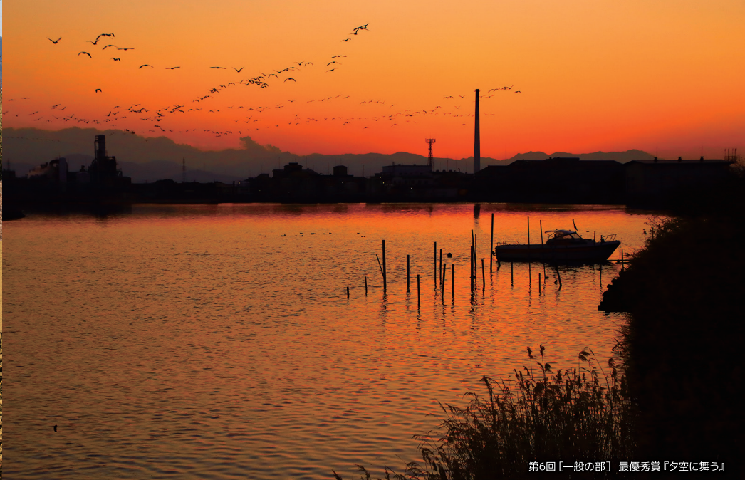
第6回【一般の部】 最優秀賞『夕空に舞う』