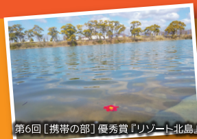
第6回【携帯の部】 優秀賞『リゾート北島』